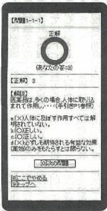
答えと解説の画面