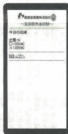
今日の成績の画面